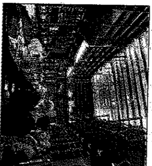
Los lazos familiares con la antigua 'Ferreria Casals'.

En su visita tampoco puede faltar una sesión de compras por la calle Montecrosy (la parada obligada en 'La Ferreria' de la Plaça de la Farinera, antigua 'Ferreria Casals' que perteneció a su familia) que hoy se ha convertido en uno de los restaurantes más conocidos del centro de Reus.